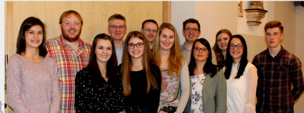
Aktueller Vorstand 2019

Ehrungen für musikalische Leistungen / Mitgliedschaft