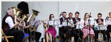
Original Knippchen Musikanten (OKM)

Musikalische Begleitung des Kindervogelschießens + Kindertanz