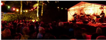
Open Air-Feeling am Waldfest in Heid